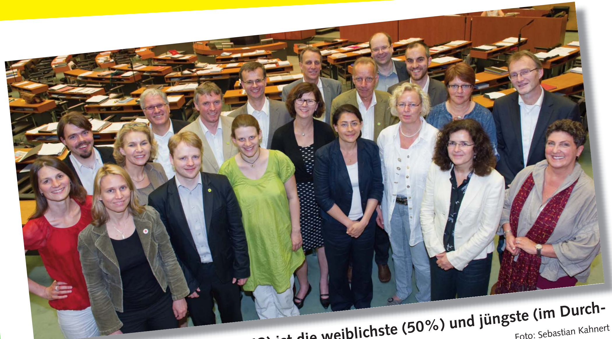
Die Grüne Landtagsfraktion (2013) ist die weiblichste (50%) und jüngste (im Durchschnitt 45 Jahre) aller Fraktionen im Landtag