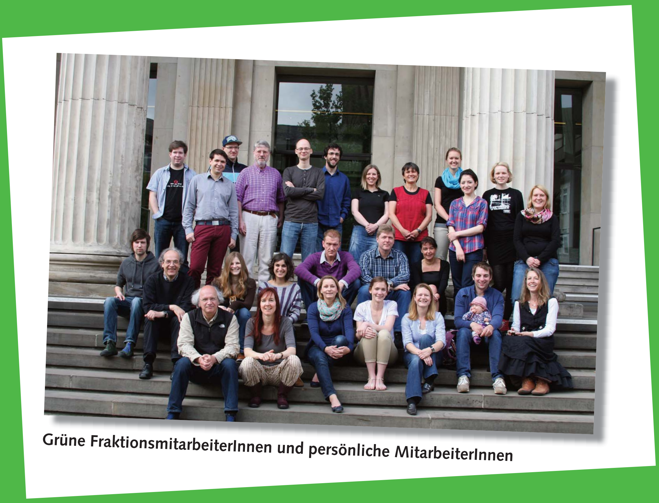
Grüne FraktionsmitarbeiterInnen und persönliche MitarbeiterInnen